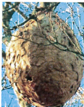
Nid de frelons asiatiques